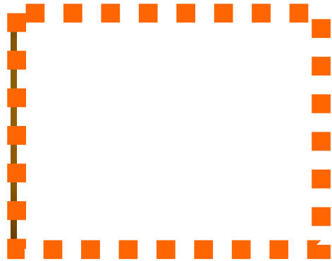
きたはら みお ちゃん (2 歳 5 ヶ月)